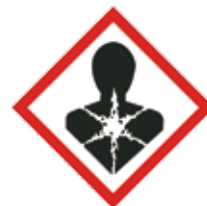
Lange termijn gezondheidsgevaarlijk