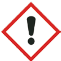
Irriterend, sensibiliserend, schadelijk