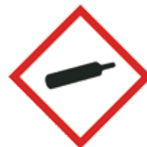
Gassen onder druk