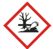
Gevaarlijk voor het aquatisch milieu